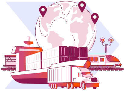
Denizler ve iç sular, kara yolları ve demir yollarında faaliyet gösteren nakliye şirketleri