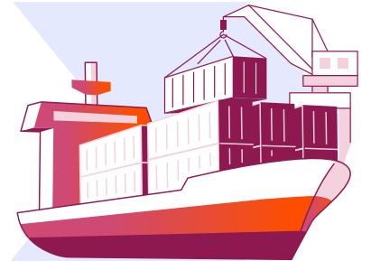
Nihai alıcılar (deniz taşımacılığında)